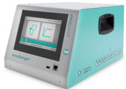
RH 1100 profiTEMP TM